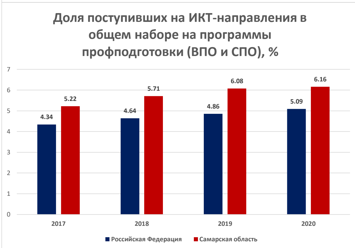
Рис. 2. Удельный вес числа абитуриентов на STEAM-направления подготовки, а также на наиболее приоритетные ИТ-специальности (ИТ-направления) в общем числе принятых на программы ВПО и СПО в Самарской области в 2017-2020 гг. (%)