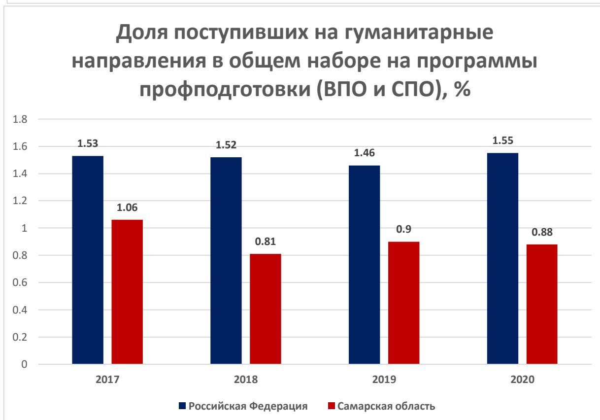
Рис. 3. Удельный вес числа абитуриентов на приоритетные направления подготовки (Робототехника, Искусства) в общем числе принятых на программы ВПО и СПО в Самарской области в 2017-2020 гг. (%)