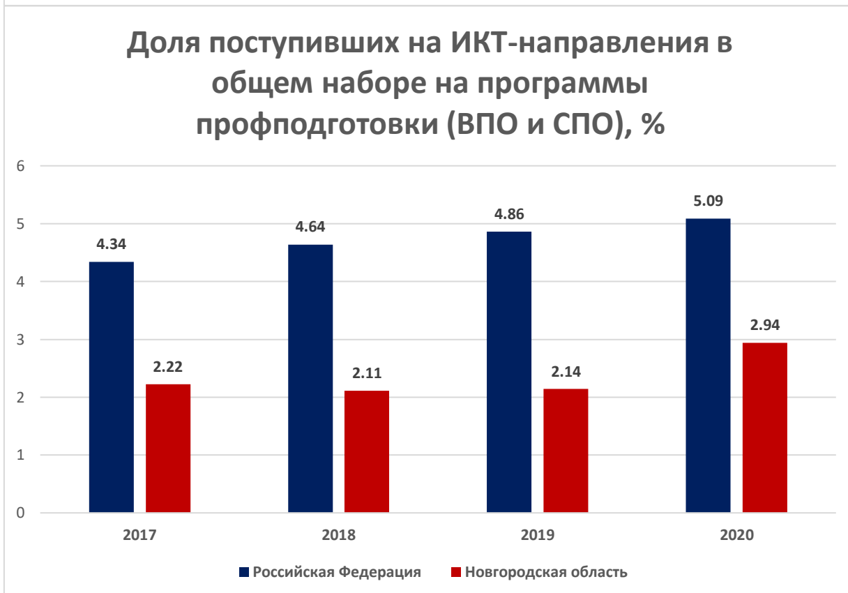
Рис. 2. Удельный вес числа абитуриентов на STEAM-направления подготовки, а также на наиболее приоритетные ИТ-специальности (ИТ-направления) в общем числе принятых на программы ВПО и СПО в Новгородской области в 2017-2020 гг. (%)