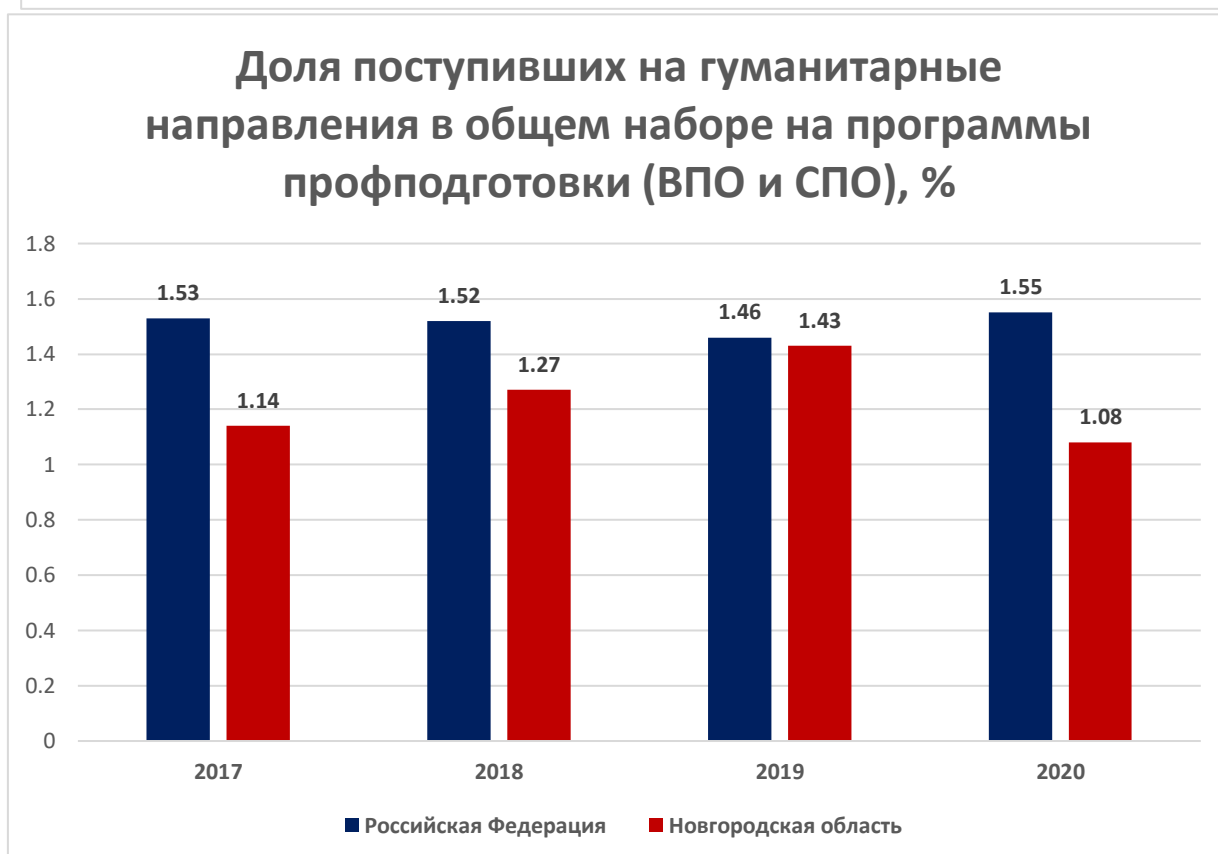
Рис. 3. Удельный вес числа абитуриентов на приоритетные направления подготовки (Робототехника, Искусства) в общем числе принятых на программы ВПО и СПО в Новгородской области в 2017-2020 гг. (%)