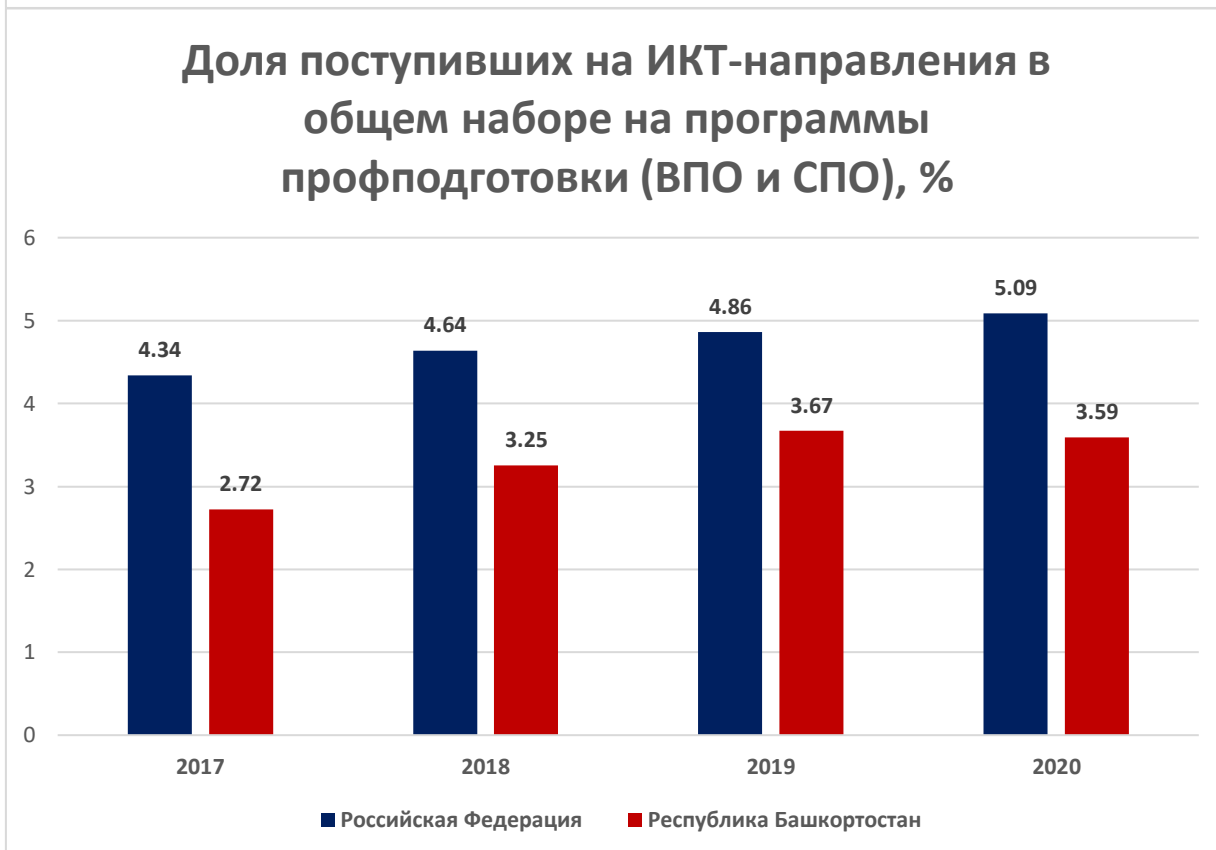
Рис. 2. Удельный вес числа абитуриентов на STEAM-направления подготовки, а также на наиболее приоритетные ИТ-специальности (ИТ-направления) в общем числе принятых на программы ВПО и СПО в Республике Башкортостан в 2017-2020 гг. (%)