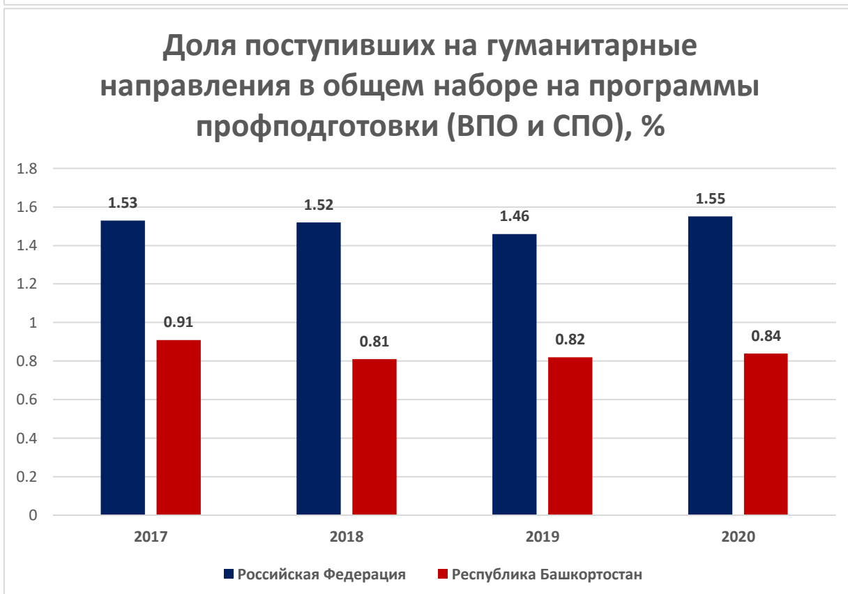
Рис. 3. Удельный вес числа абитуриентов на приоритетные направления подготовки (Робототехника, Искусства) в общем числе принятых на программы ВПО и СПО в Республике Башкортостан в 2017-2020 гг. (%)