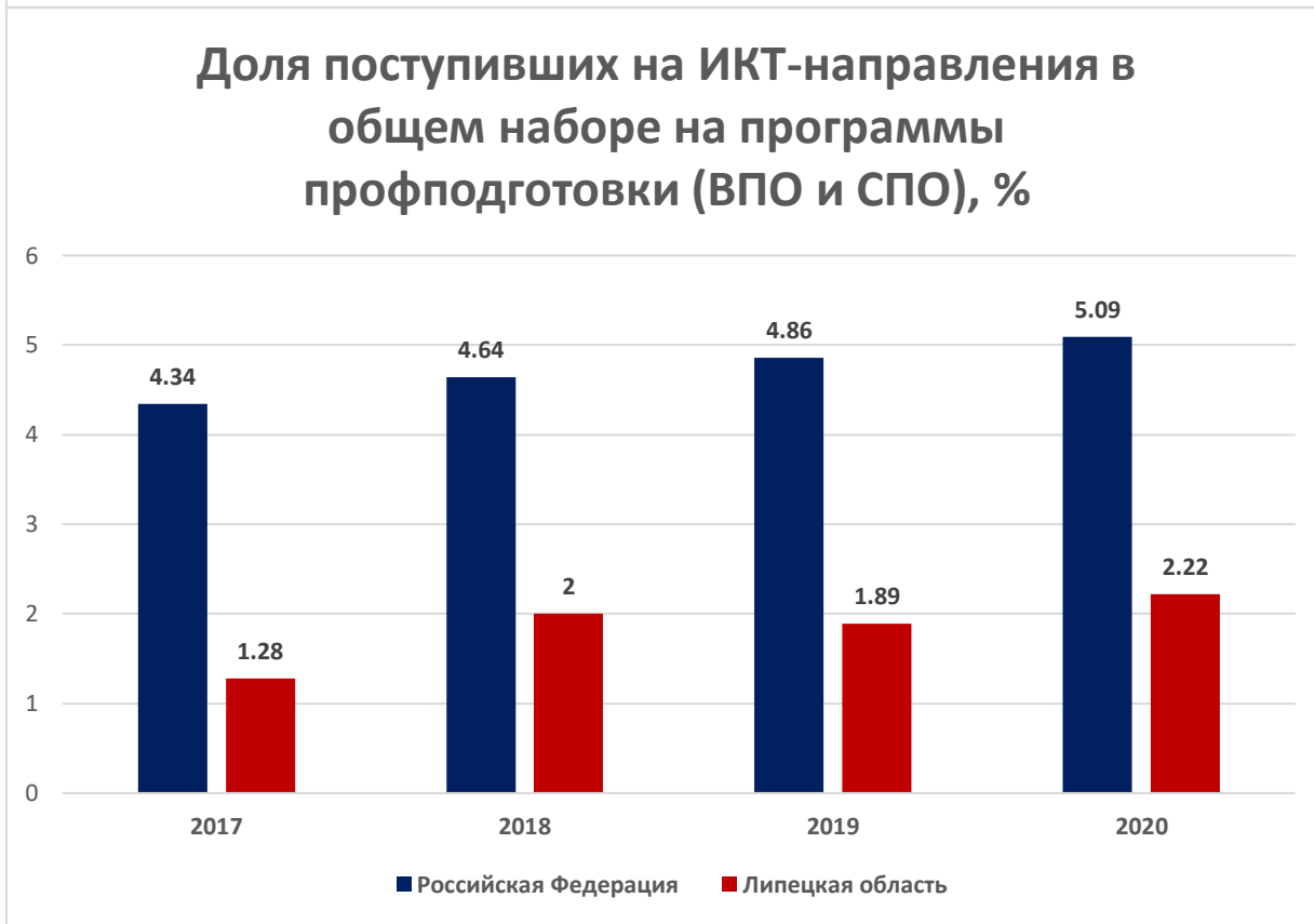
Рис. 2. Удельный вес числа абитуриентов на STEAM-направления подготовки, а также на наиболее приоритетные ИТ-специальности (ИТ-направления) в общем числе принятых на программы ВПО и СПО в Липецкой области в 2017-2020 гг. (%)