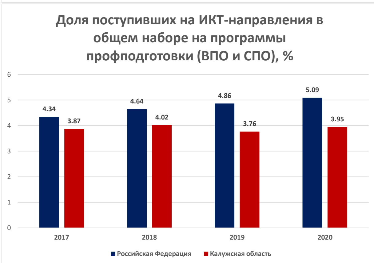
Рис. 2. Удельный вес числа абитуриентов на STEAM-направления подготовки, а также на наиболее приоритетные ИТ-специальности (ИТ-направления) в общем числе принятых на программы ВПО и СПО в Калужской области в 2017-2020 гг. (%)