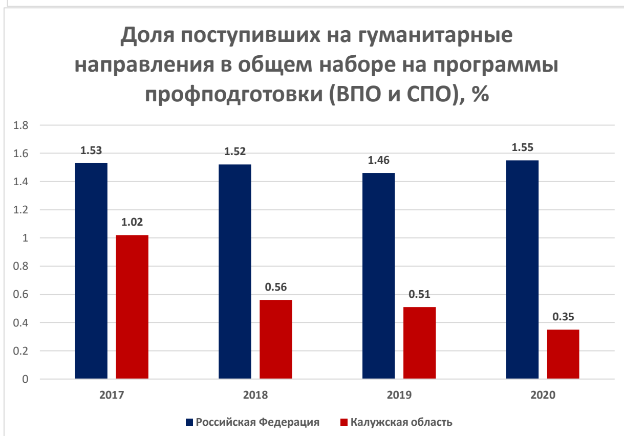
Рис. 3. Удельный вес числа абитуриентов на приоритетные направления подготовки (Робототехника, Искусства) в общем числе принятых на программы ВПО и СПО в Калужской области в 2017-2020 гг. (%)