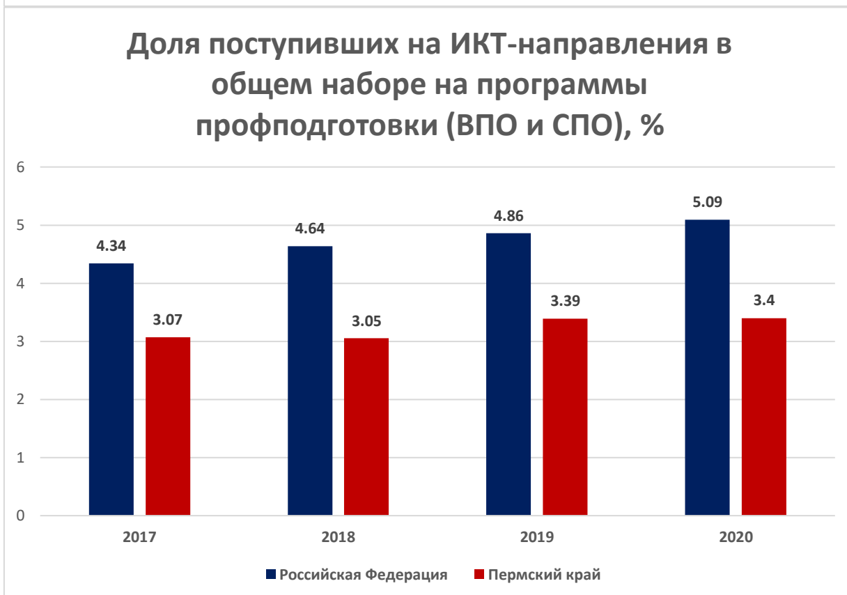
Рис. 2. Удельный вес числа абитуриентов на STEAM-направления подготовки, а также на наиболее приоритетные ИТ-специальности (ИТ-направления) в общем числе принятых на программы ВПО и СПО в Пермском крае в 2017-2020 гг. (%)