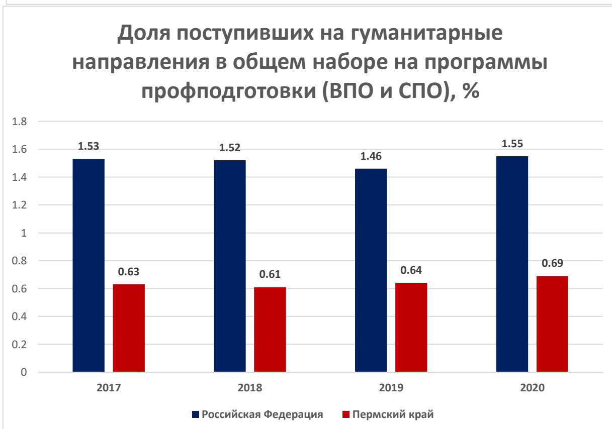
Рис. 3. Удельный вес числа абитуриентов на приоритетные направления подготовки (Робототехника, Искусства) в общем числе принятых на программы ВПО и СПО в Пермском крае в 2017-2020 гг. (%)