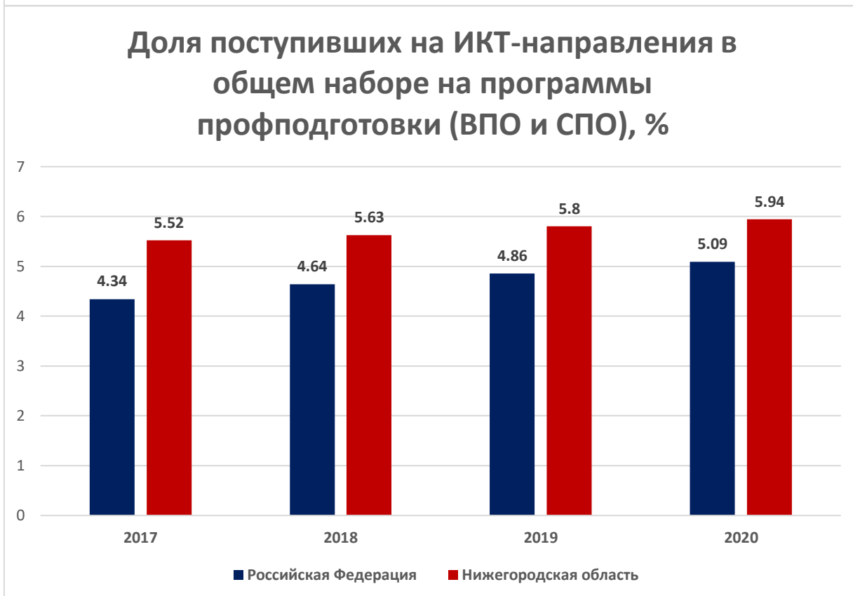
Рис. 2. Удельный вес числа абитуриентов на STEAM-направления подготовки, а также на наиболее приоритетные ИТ-специальности (ИТ-направления) в общем числе принятых на программы ВПО и СПО в Нижегородской области в 2017-2020 гг. (%)