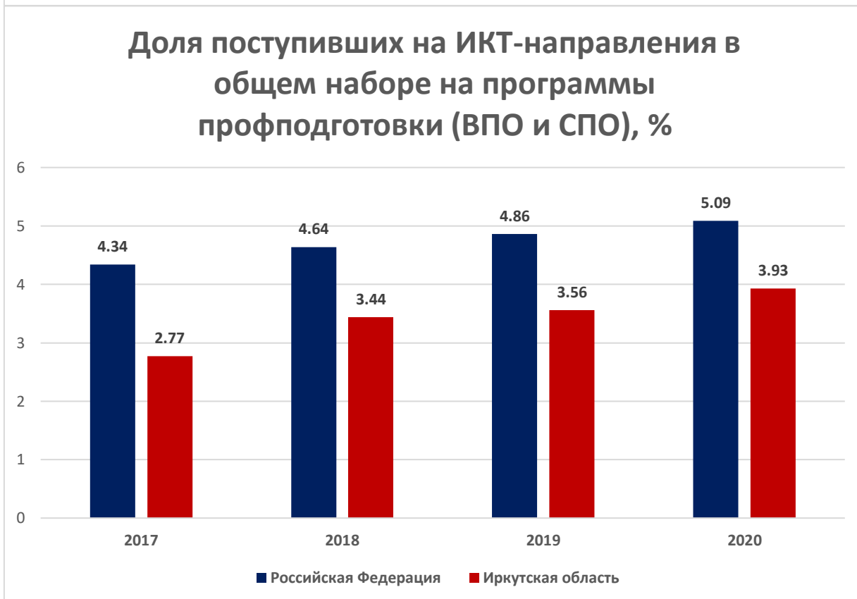
Рис. 2. Удельный вес числа абитуриентов на STEAM-направления подготовки, а также на наиболее приоритетные ИТ-специальности (ИТ-направления) в общем числе принятых на программы ВПО и СПО в Иркутской области в 2017-2020 гг. (%)