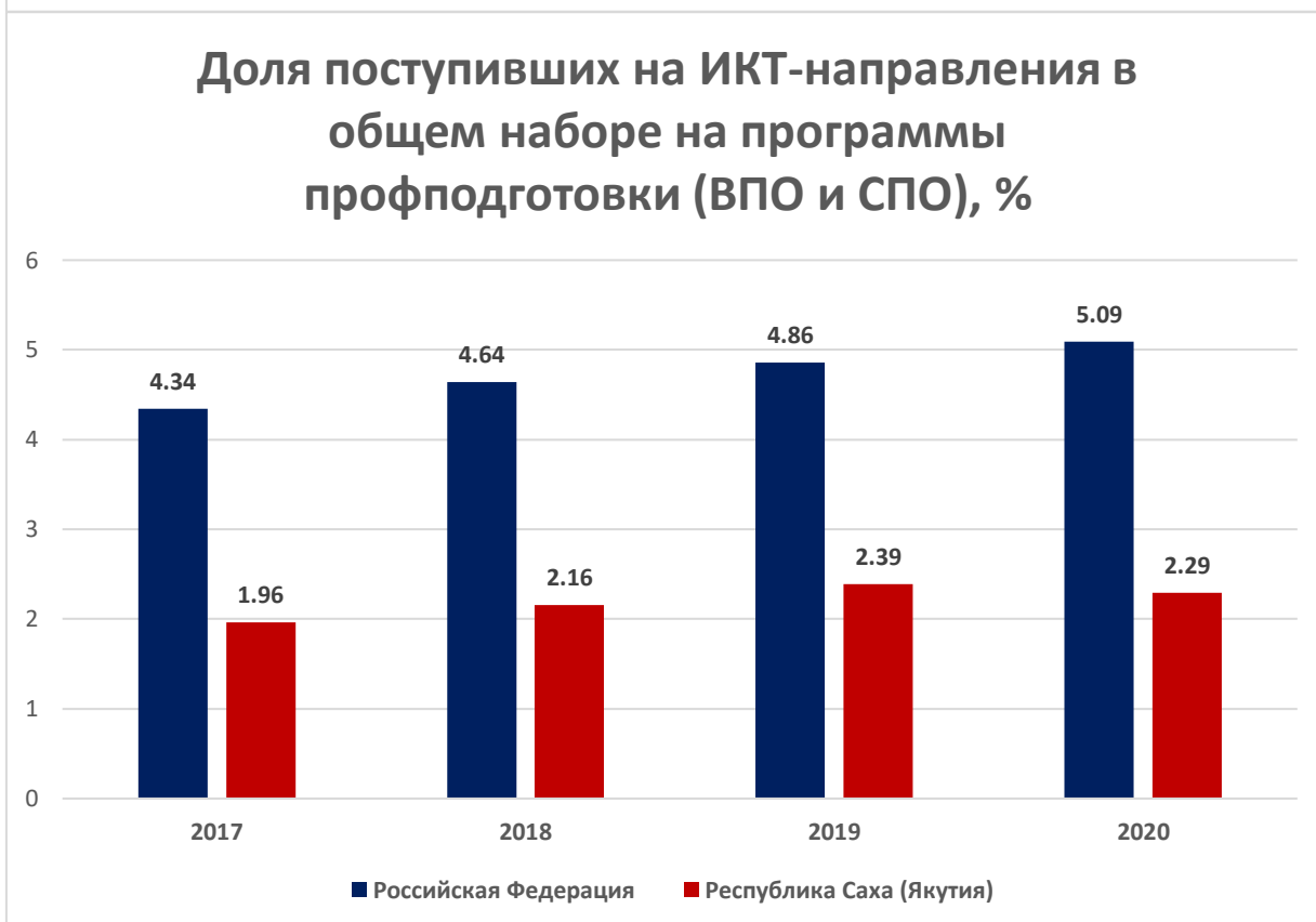
Рис. 2. Удельный вес числа абитуриентов на STEAM-направления подготовки, а также на наиболее приоритетные ИТ-специальности (ИТ-направления) в общем числе принятых на программы ВПО и СПО в Республике Саха (Якутия) в 2017-2020 гг. (%)