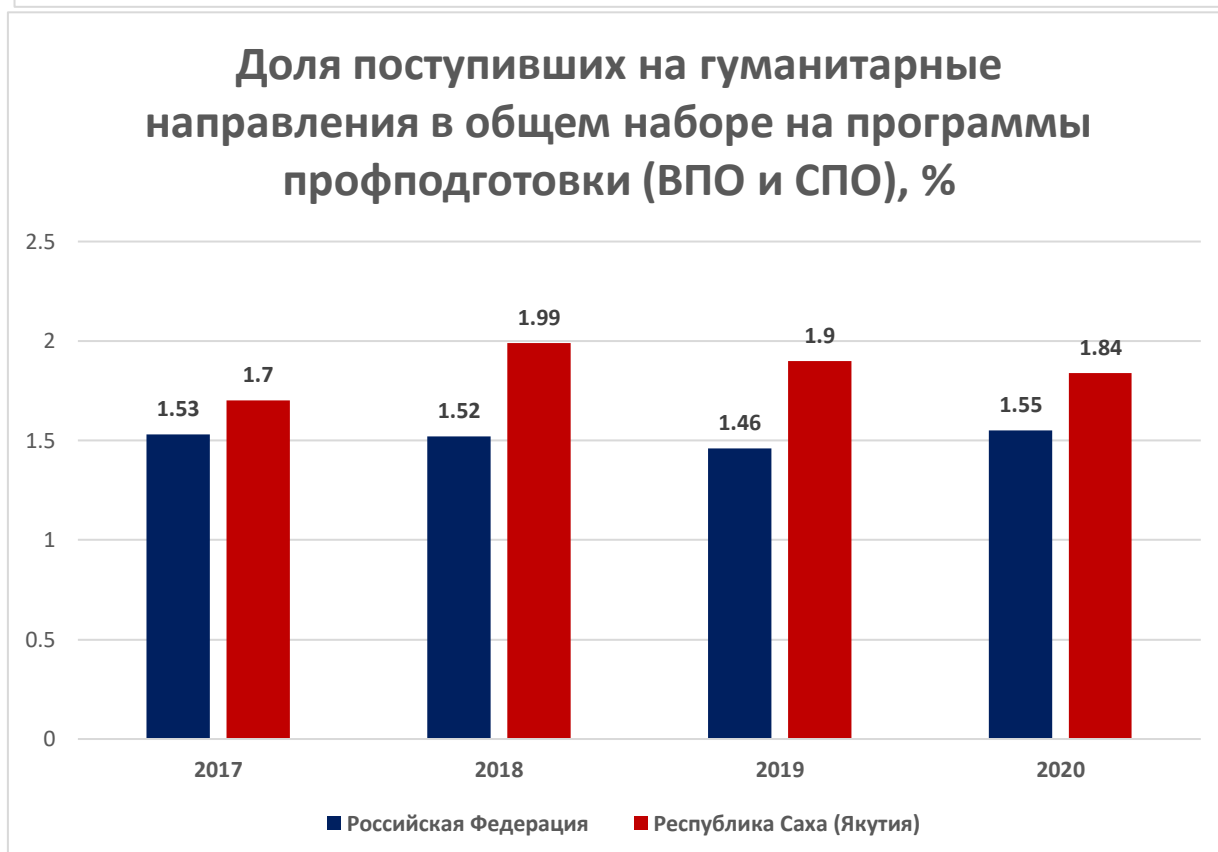
Рис. 3. Удельный вес числа абитуриентов на приоритетные направления подготовки (Робототехника, Искусства) в общем числе принятых на программы ВПО и СПО в Республике Саха (Якутия) в 2017-2020 гг. (%)